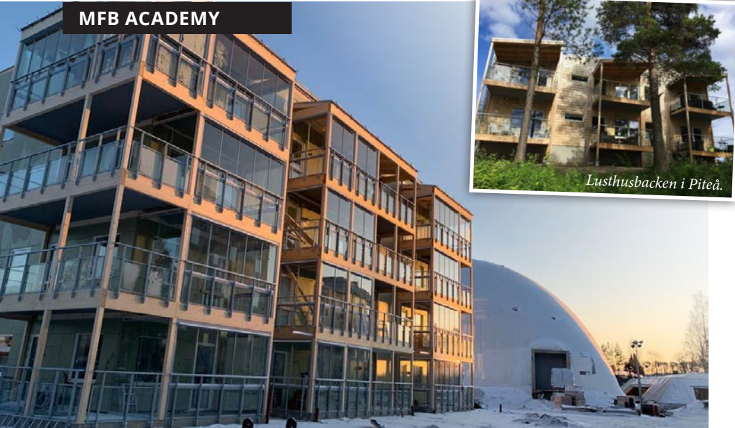
57 bostadsrätter på Karlagården i Skellefteå.