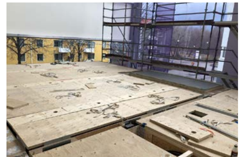
I Enköping bygger Grönbo ett åttavåningshus med Masonite Beams bjälklags- och väggelement.